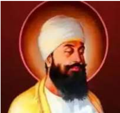
ഗുരു തേജ് ബഹാദൂർ സാഹിബ് ജി

ഇന്ത്യയിൽ ആദ്യമായി 400 രൂപയുടെ നാണയം പുറത്തിറക്കി.. ഒൻപതാമത്തെ സിഖ് ഗുരുവായ ഗുരു തേജ് ബഹാദൂറിന്റെ നാനൂറാം ജന്മദിനത്തിന്റെ ഭാഗമായാണ് ആർ.ബി.ഐ. 400 രൂപയുടെ പുതിയ കൊമ്മെമ്മറേറ്റീവ് കോയിൻ പുറത്തുറക്കിയത്. പൊതുവിപണിയിൽ ലഭ്യമല്ല. നേരത്തേ ബുക്ക് ചെയ് തവർക്ക് മാത്രമേ നാണയം ലഭിക്കുകയുള്ളൂ.