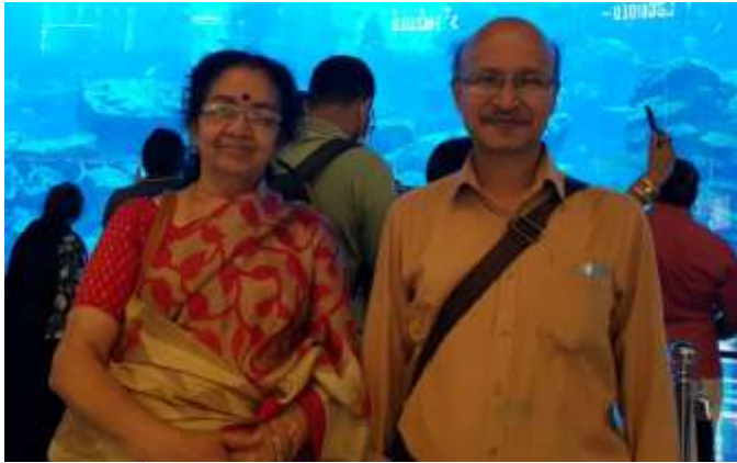
ബുർജ് വലീഫയ്ക്കുള്ളിലെ അകേറിയത്തിനു മുമ്പിൽ

ഹോസ്റ്റസ് ഡിന്നറുമായി വന്നു വിളിച്ചു. ഓർമ്മകളുടെ തഴുകൽ അവിടെ നിലച്ചു. രാത്രിയിൽ രണ്ടു മണിക്കൂർ ഇടവിട്ട് കോഫിയും, ജൂസും ഒക്കെയായി എയർ ഹോസ്റ്റസുമാർ വന്ന് വിളിച്ചു കൊണ്ടേയിരുന്നു.