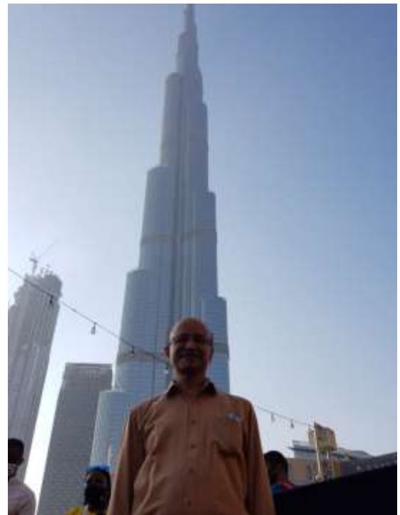
പിന്നിൽ ബുർജ് വലീഫ

അടുത്ത കാലം വരെ ദുബായ് ലെ ബുർജ് വലീഫയായിരുന്നു ലോകത്തിലെ ഏറ്റവും ഉയരം കൂടിയ കെട്ടിടം. ഉയരം 828 മീറ്ററും, (2717 അടി) 164 നിലകളുമാണിതിനുള്ളത്.