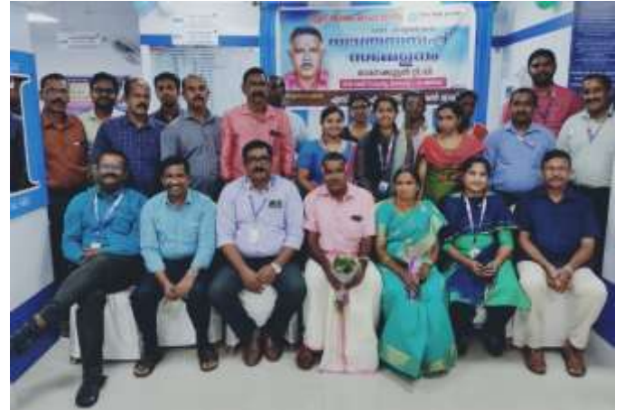
മേയ് 31ന് റാന്നി തോട്ടമൺ ശാഖയിൽ നിന്ന് വിരമിച്ച ഓമനക്കൂട്ടൻ.ടി.വി.യ്ക്ക് നൽകിയ യാത്രയയപ്പ് യോഗത്തിൽ നിന്ന്.